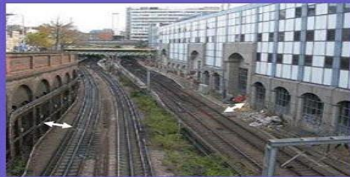
Tepi Rel Kereta Api

Garis maya pada persil atau tapak yang merupakan jarak bebas minimum dari bidang-bidang terluar bangunan gedung yang diperkenankan didirikan bangunan ditarik pada jarak tertentu sejajar terhadap: