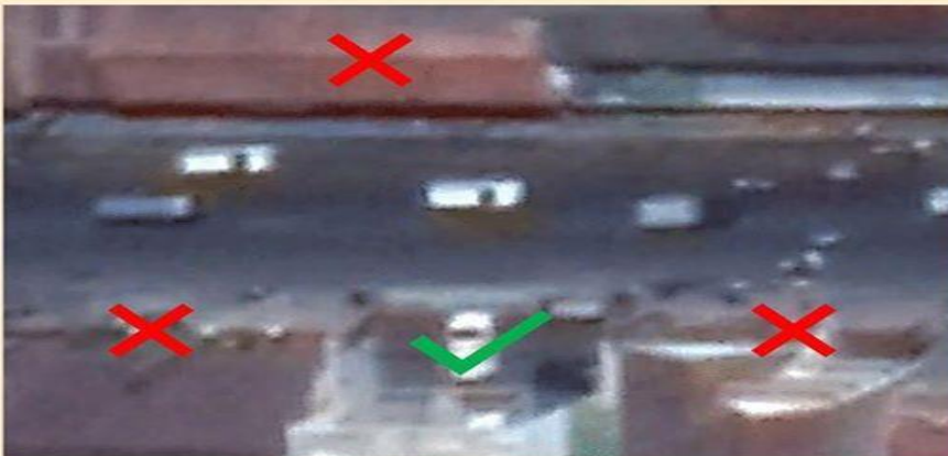
Hanya 1 dari 4 yang menaati aturan GSB.

Contoh: sebuah jalan di Kota Yogyakarta dalam RDTR kota memiliki GSB selebar 6 meter.