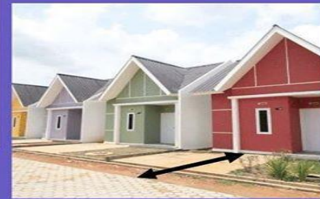
Ruang Milik Jalan (Rumija)